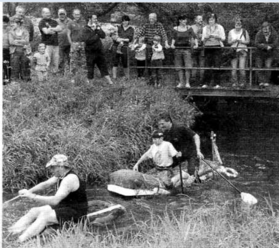
, kterou organizují. Jsou však i iniciátory kulturního dění v obci stejně řeky a podobně.

venkovních prostor a čištění koupaliště, které se letos zřejmě dočká rekonstrukce, pat-