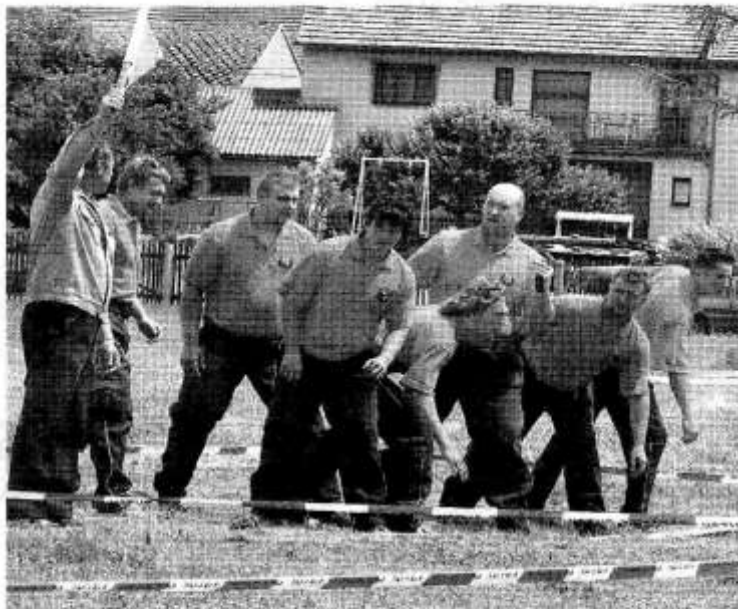
DOBROVOLNÍ HASIČI z Újezda se pravidelně účastní soutěže Hurá útok jako recesisté, kteří pořádají mnohé zajímavé akce jako splouvání divok

„Protože je mladých ve sboru méně, sportovní hasičské činnosti a výjezdům po soutěžích se náš sbor neúčastní. Důraz klademe ale na kulturní činnost a vzájemné setkávání se při různých příležitostech. Pořádáme v na-